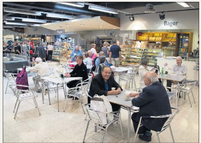
Et egentlig opholdsted er Kwicklys café ikke. Den indbyder i stedet til en hurtig kop kaffe med brød og kager af god kvalitet.