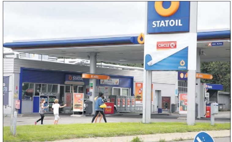
Skal man haste på arbejde fra Ålsgårde til hovedstaden tidlige morgener, så er Circle K eller Statoil næsten perfekt.

Jesper var ikke i butikken da jeg ankom, men jeg kun-